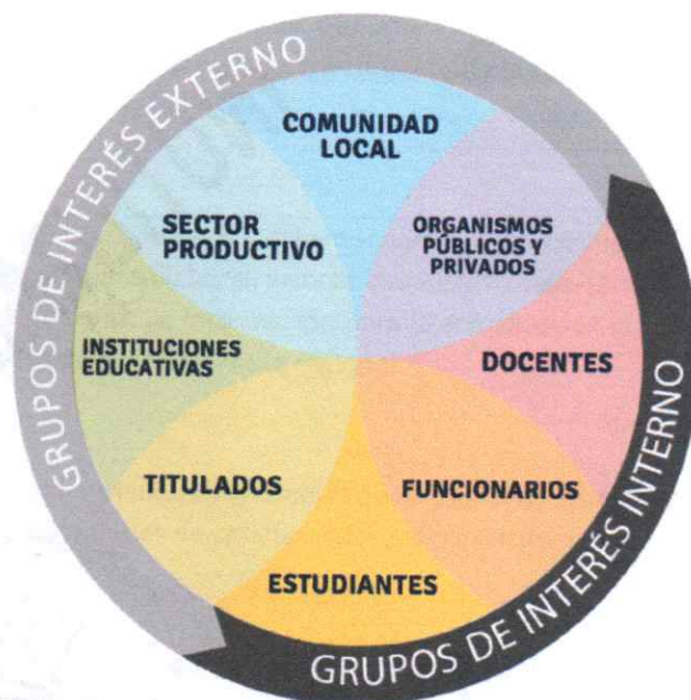
Figura 1. Grupos de Interés para la Vinculación, PDI CFT Estatal de Tarapacá 2019 – 2023.