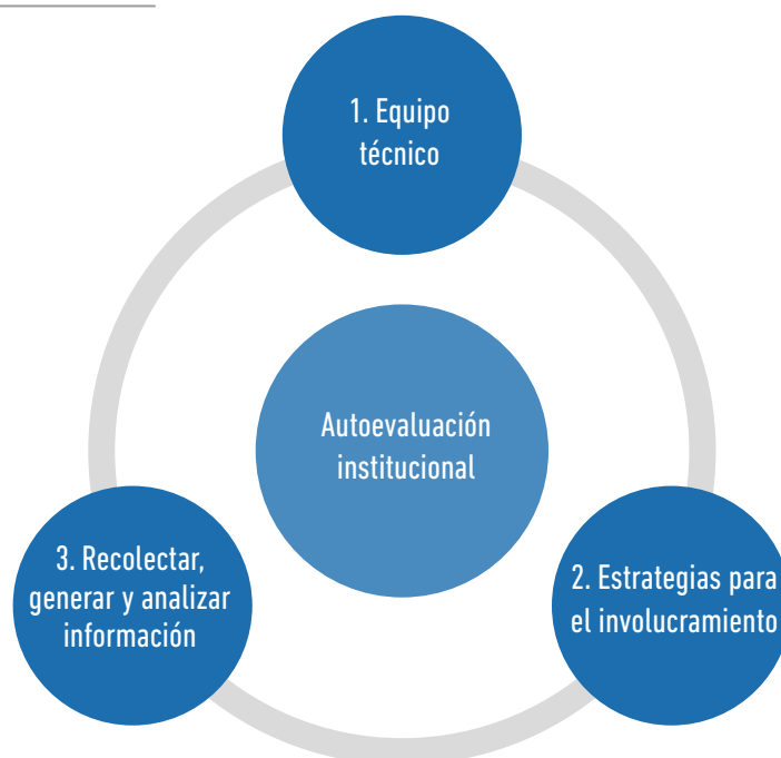
FIGURA 2: Recomendaciones para el proceso de autoevaluación

Para que un proceso de autoevaluación se desarrolle de manera adecuada y aporte a la mejora continua, es importante considerar algunos factores que contribuyen a un buen desarrollo del proceso: